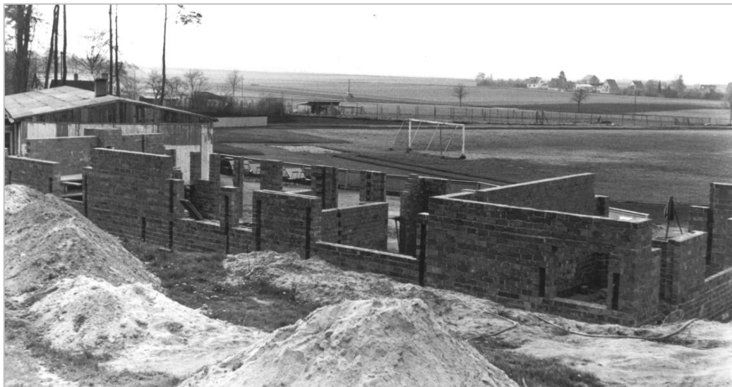
Die Baustelle des Sportheims 1965. Vorne rechts der spätere Ballraum. Links hinten die Tischtennisbaracke. Das Fußballfeld wurde von einer Aschenbahn umgrenzt. Im Hintergrund die Häuser von Unterfürberg.